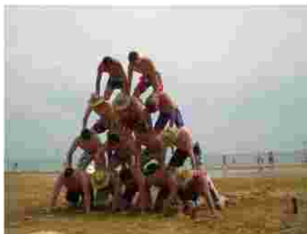
Blödsinn am Strand